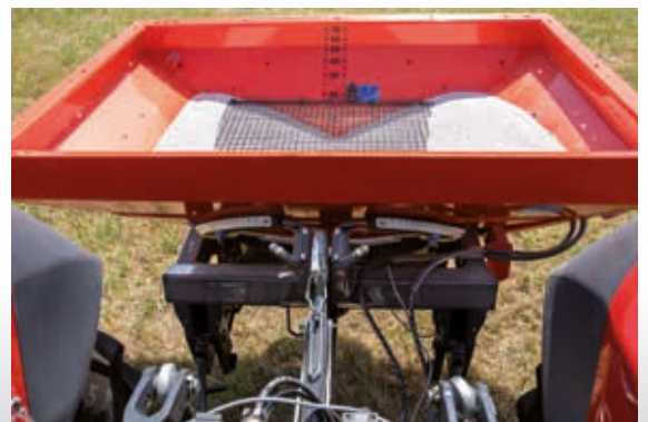
Système à une chambre

Le système à une chambre permet une construction très compacte. Ceci permet une fertilisation efficace même avec un petit tracteur.