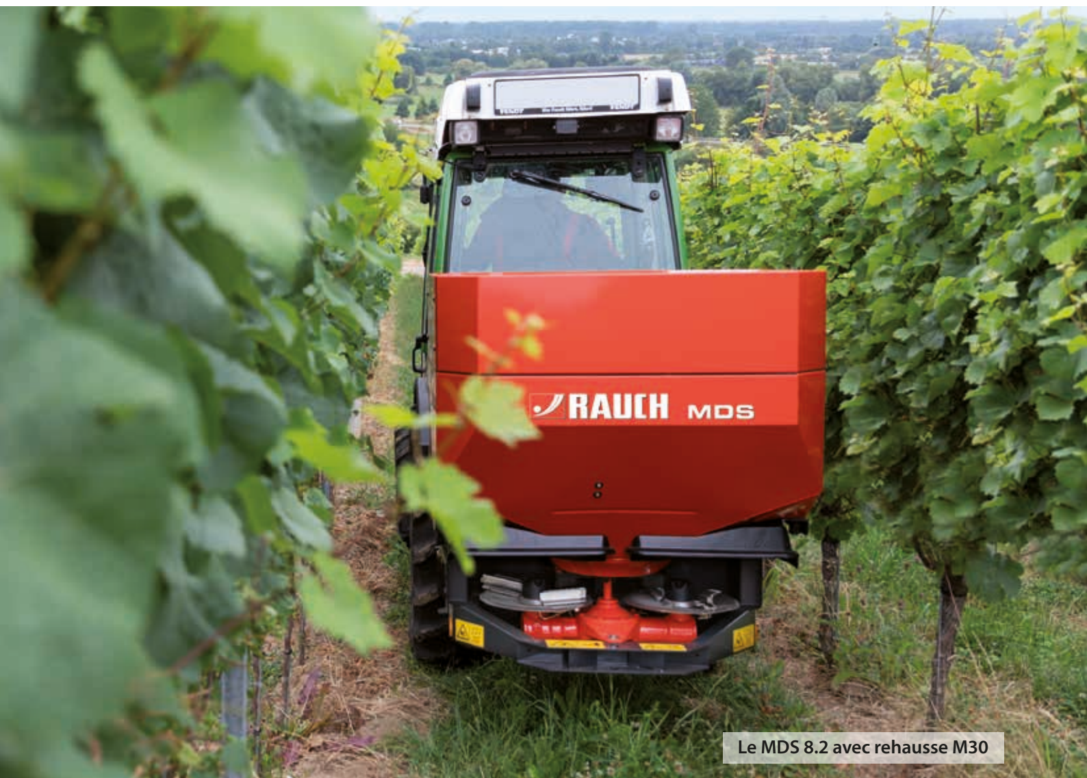
Le MDS 8.2 avec rehausse M30

Les épandeurs MDS sont indispensables pour une utilisation professionnelle dans la culture des fruits, du vin ou du houblon et sont parfaitement préparés à cette tâche grâce à des solutions innovantes et détaillées.