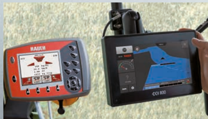
QUANTRON-A avec GPS-Control

Les épandeurs MDS de la dernière génération avec l'ordinateur d'épandage QUANTRON-A disposent en série de la coupe de tronçons en 8 sections VariSpread V8. Quatre largeurs partielles sont possibles de chaque côté grâce au réglage à distance de la position des vannes de dosage. La procédure peut être manuelle en appuyant sur un bouton ou être utilisée, en combinaison avec un ordinateur GPS séparé avec Section Control, comme une commande automatique de tournière et de tronçons.