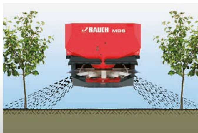
Montage du dispositif d'épandage à rangs RV 2M

Le dispositif d'épandage sur 2 rangs RV 2M permet la fertilisation ciblée au niveau des racines de plantations en rangées. Aucun granulé ne tombe dans la trace du tracteur. Cela permet d'économiser de l'engrais précieux et d'alléger la charge sur l'environnement. L'équipement RV 2M se règle facilement et de façon variable sur des écarts de 2 à 5 m entre les rangées.