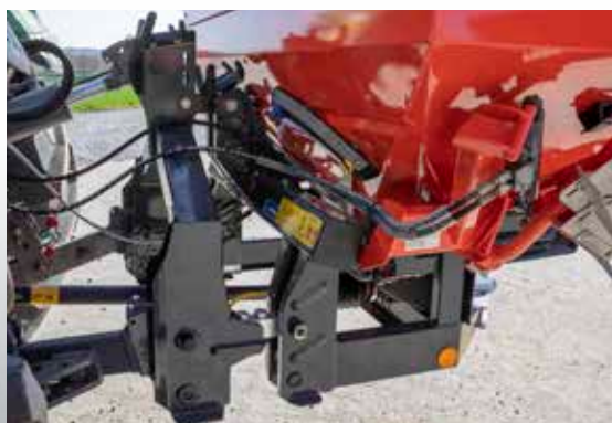
Châssis de pesée

Le QUANTRON-A permet de toujours relever précisément le contenu de la trémie au kilogramme près. La surface restant restant encore à épandre est visible à tout moment.