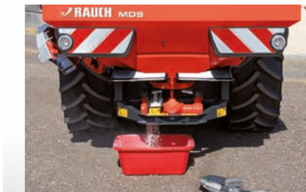
Contrôle de débit

Tous les modèles MDS sont également adaptés à la nutrition des plantes en agriculture biologique. RAUCH propose des tableaux d'épandage pour les engrais agréés ainsi que pour les engrais organiques sous forme de granulés ou de pellets.