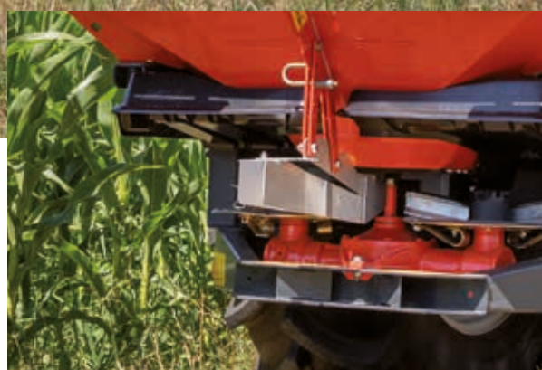
GSE 7, l'épandage en limite à partir de la limite du champ