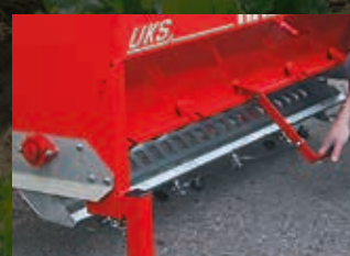
Fond pliable en acier inoxydable