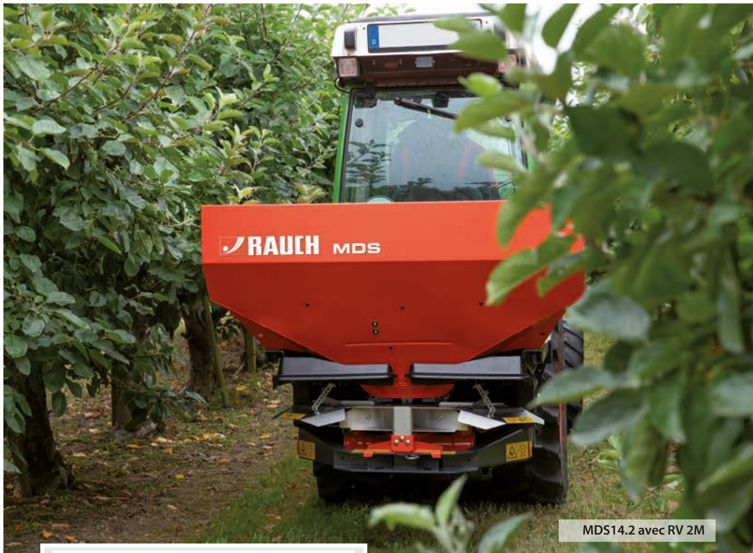
MDS14.2 avec RV 2M