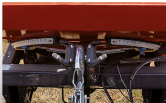
Échelles DfC facilement visibles