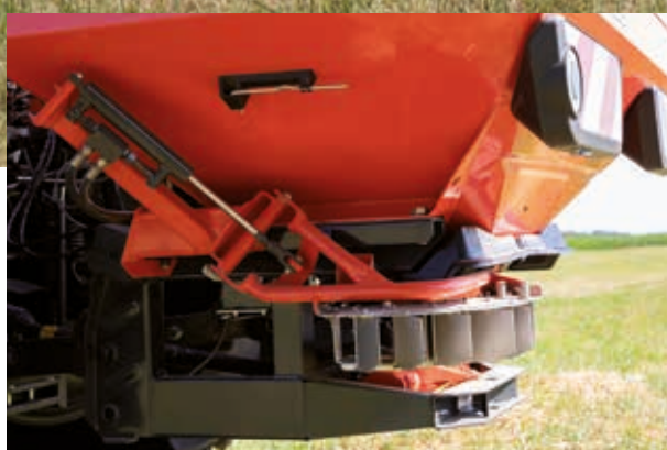
TELIMAT, l'épandage en limite depuis le jalonnage

Le GSE 7 est un dispositif d'épandage en bordure et en limite à commande manuelle qui permet un épandage unilatéral (à gauche ou à droite) à arêtes vives directement depuis la limite du champ. L'équipement peut être commandé à distance sur demande et peut également être combiné avec TELIMAT.