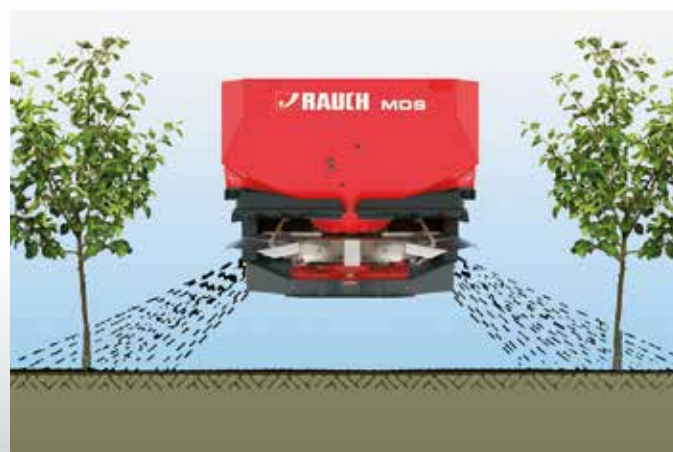
Wirkungsweise der Reihenstreuvorrichtung RV 2M

Die Reihenstreuvorrichtung RV 2M ermöglicht eine gezielte Nährstoffgabe im Wurzelbereich von Reinkulturen. In die Fahrspur fallen dabei keine Granulate. So wird wertvoller Dünger eingespart und die Umwelt entlastet. RV 2M lässt sich einfach und variabel auf Reihenabstände zwischen 2 bis 5 m einstellen.