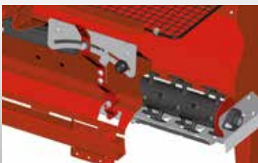
Rührwelle mit verschleißfesten Kunststoffelementen und Dosieröffnung

Die patentierte Rührwelle mit flexiblen, verschleißfesten Rührfingern führt das Streugut kontinuierlich den Dosieröffnungen zu und sorgt für das problemlose Nachrutschen aller bekannten Streumittel in granulierter, mehlig oder organischer Form, zudem von Saatgütern jeder Art, Sand, Kompost und vegetabilen Düngern, ja selbst pulvrige Streugüter wie Basamid. Weiterer Vorteil: Der Wechsel des Streumittels erfolgt ohne Umbau oder Zusatzausrüstung.