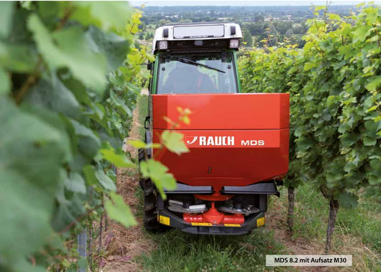
MDS 8.2 mit Aufsatz M30

MDS-Streuer sind unentbehrlich für den professionellen Einsatz im Obst-, Wein- oder Hopfenanbau und mit innovativen Detaillösungen perfekt auf diese Aufgabe vorbereitet.