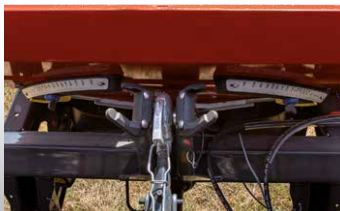
Gut einsehbare DfC-Skalen