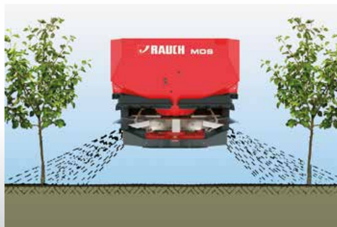
Način delovanja mehanizma za redno posipanje RV 2M

Mehanizam za redno rasipanje RV 2M omogućuje ciljano rasipanje prehrane u području korena rednih kultura. Pritom granulat ne pada po stalnim tragovima. Tako se šteti vredno đubrivo i rasterećuje životna sredina. RV 2M može jednostavno i promenljivo da se podešava prema razmacima između redova od 2 do 5 m.