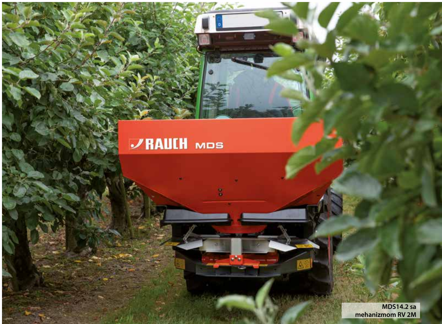
MDS14.2 sa mehanizmom RV 2M