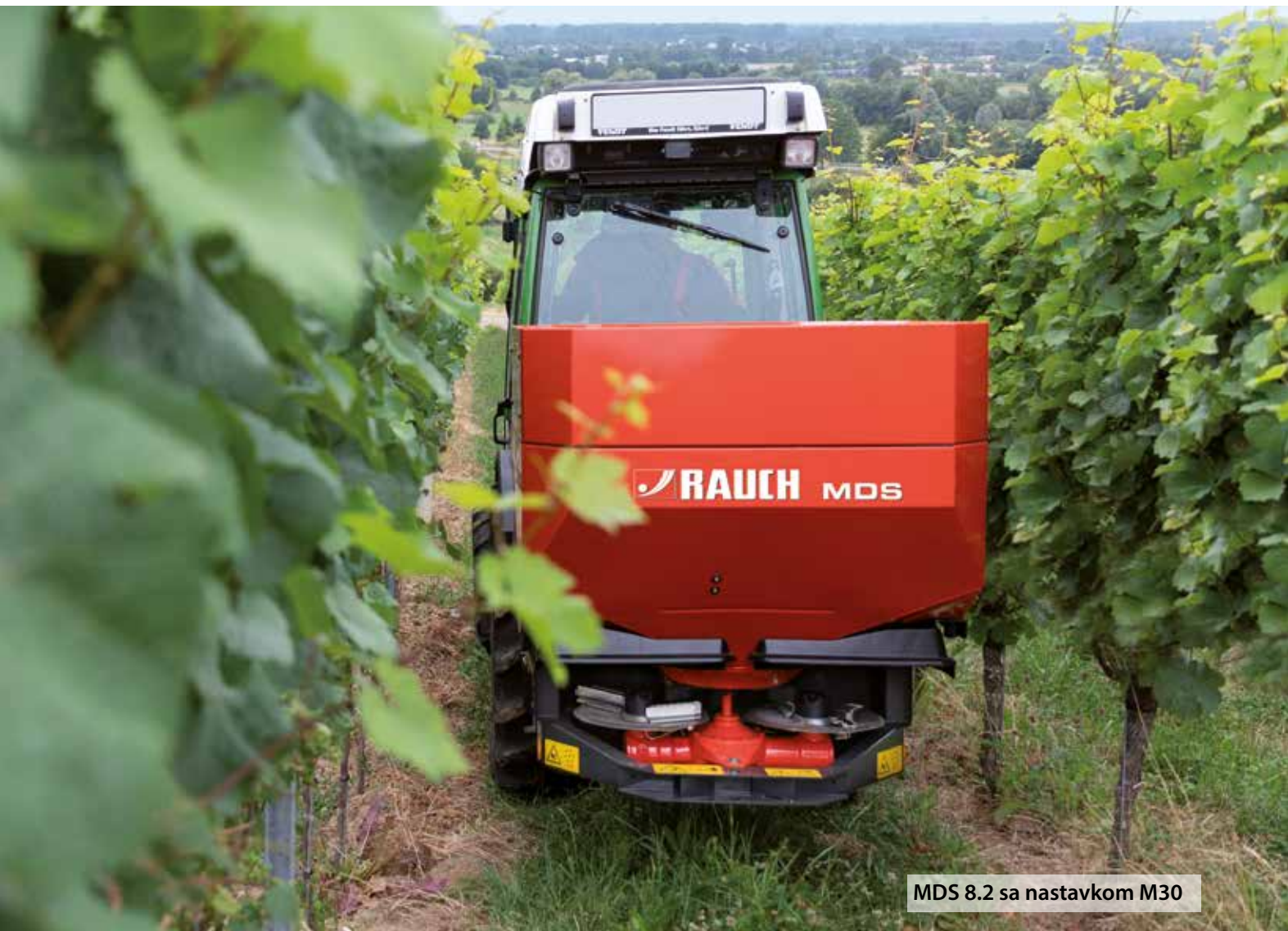
MDS 8.2 sa nastavkom M30

MDS rasipači su nezamenljivi kada je u pitanju profesionalna upotreba u voćarstvu, vinogradarstvu ili hmeljarnicima i savršeno je pripremljena za te zadatke zahvaljujući svojim inovativnim detaljnim rešenjima.