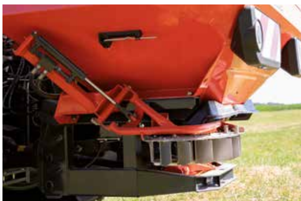
TELIMAT, granično rasipanje iz vožnje po stalnim tragovima

GSE 7 je mehanizam za granično i obodno rasipanje na ručno upravljanje koji omogućuje jednostrano (ulevo ili udesno) rasipanje pod oštrim uglom direktno od granice njive. Mehanizmom može po želji da se upravlja i na daljinu, a može i da se kombinuje i sa mehanizmom TELIMAT.