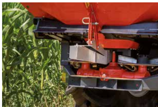
GSE 7, granično rasipanje od granice njive