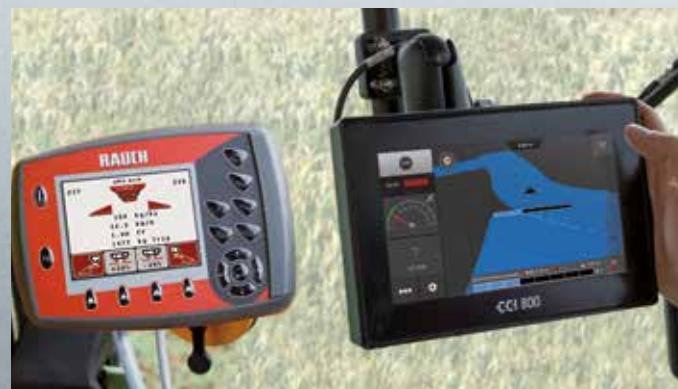
QUANTRON-A sa funkcijom GPS-Control

MDS.2 sa QUANTRON-A ručnim podešavanjem CDA tačke dopremanja đubriva poseduju serijski 8-struko uključivanje delimičnih širina. Ova alternativna opcija za VariSpread Pro omogućuje realizovanje četiri delimične širine po strani putem podešavanja položaja zasuna za doziranje na daljinsko upravljanje.