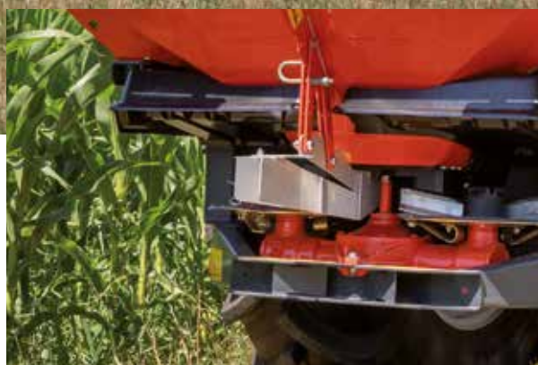
GSE 7, внесение на границе поля от границы поля