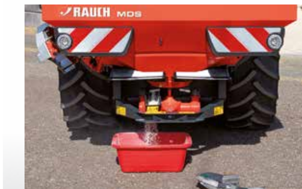
Пробная настройка нормы внесения

Все модели MDS также подходят для подкормки растений в экологическом земледелии. RAUCH предлагает таблицы внесения для допущенных удобрений и гранулированных или кристаллических органических удобрений.