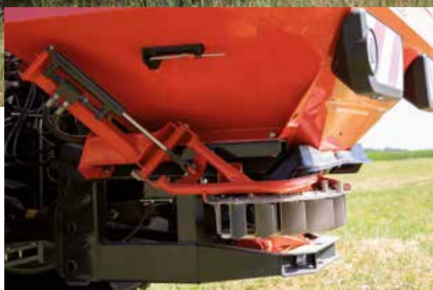
TELIMAT, внесение на границе поля с технологической колеи