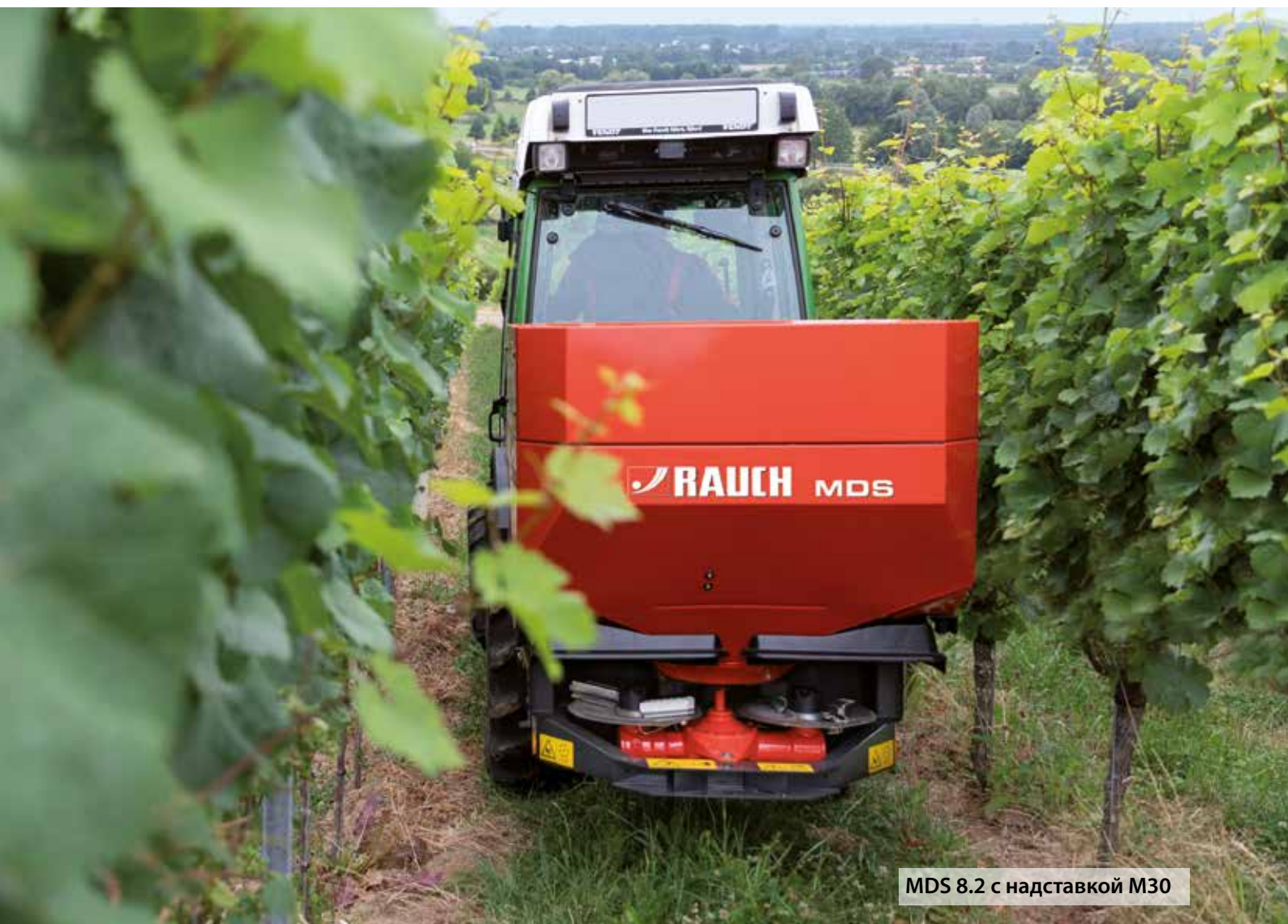
MDS 8.2 с надставкой M30

Разбрасыватели MDS незаменимы для профессионального использования в овощеводстве, виноградарстве и хмелеводстве и идеально подходят для этой задачи благодаря инновационным решениям.