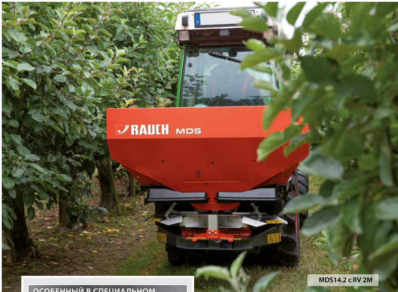
MDS14.2 с RV 2M